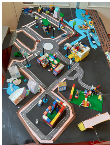
De rijkdom van zelf opgebouwd spelverhaal

De verschillende scripts die in het regisserend spel naar voren komen worden ook gebruikt voor lees- en schrijfactivitei-